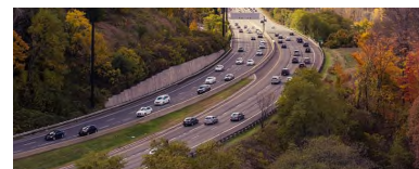
Vorlage 8: PET