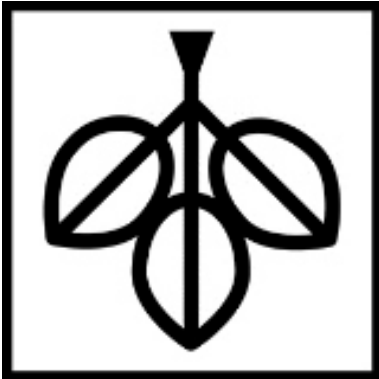
Vorlage 6: Kleider